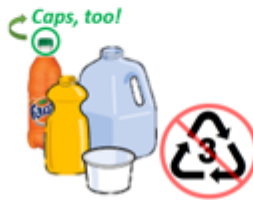
Rinsed Plastics (PET, etc.)