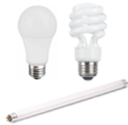
Light bulbs and tube lights