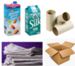
Papers & paper towel rolls