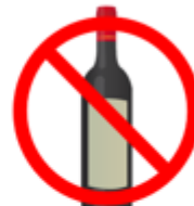
No wine bottles (Recycling only)