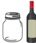
Rinsed Glass bottles, jars, wine bottles